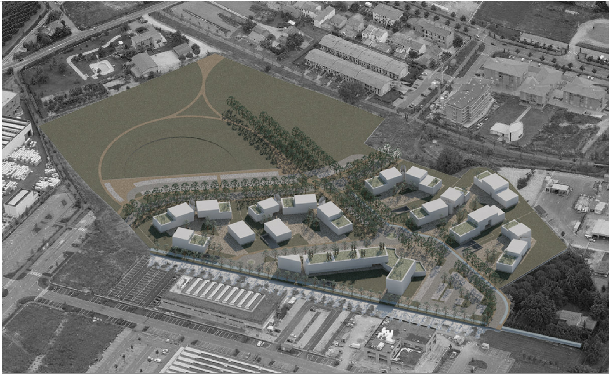
2 - FOTOINSERIMENTO - VISTA AEREA DA NORD EST