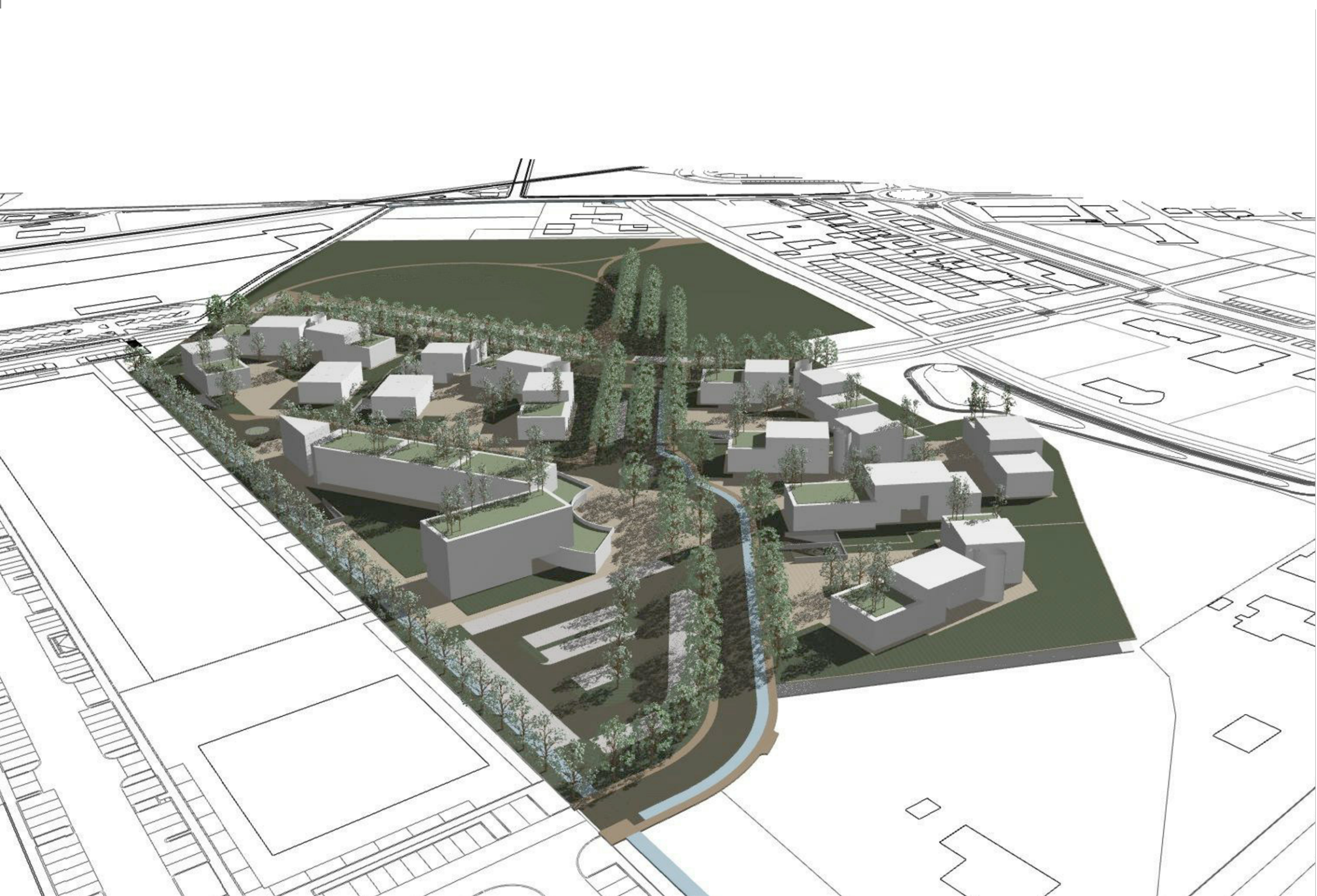
7 - STUDIO VOLUMETRICO - VISTA DA NORD