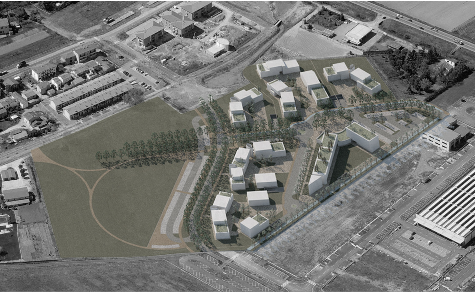
1 - FOTOINSERIMENTO - VISTA AEREA DA EST