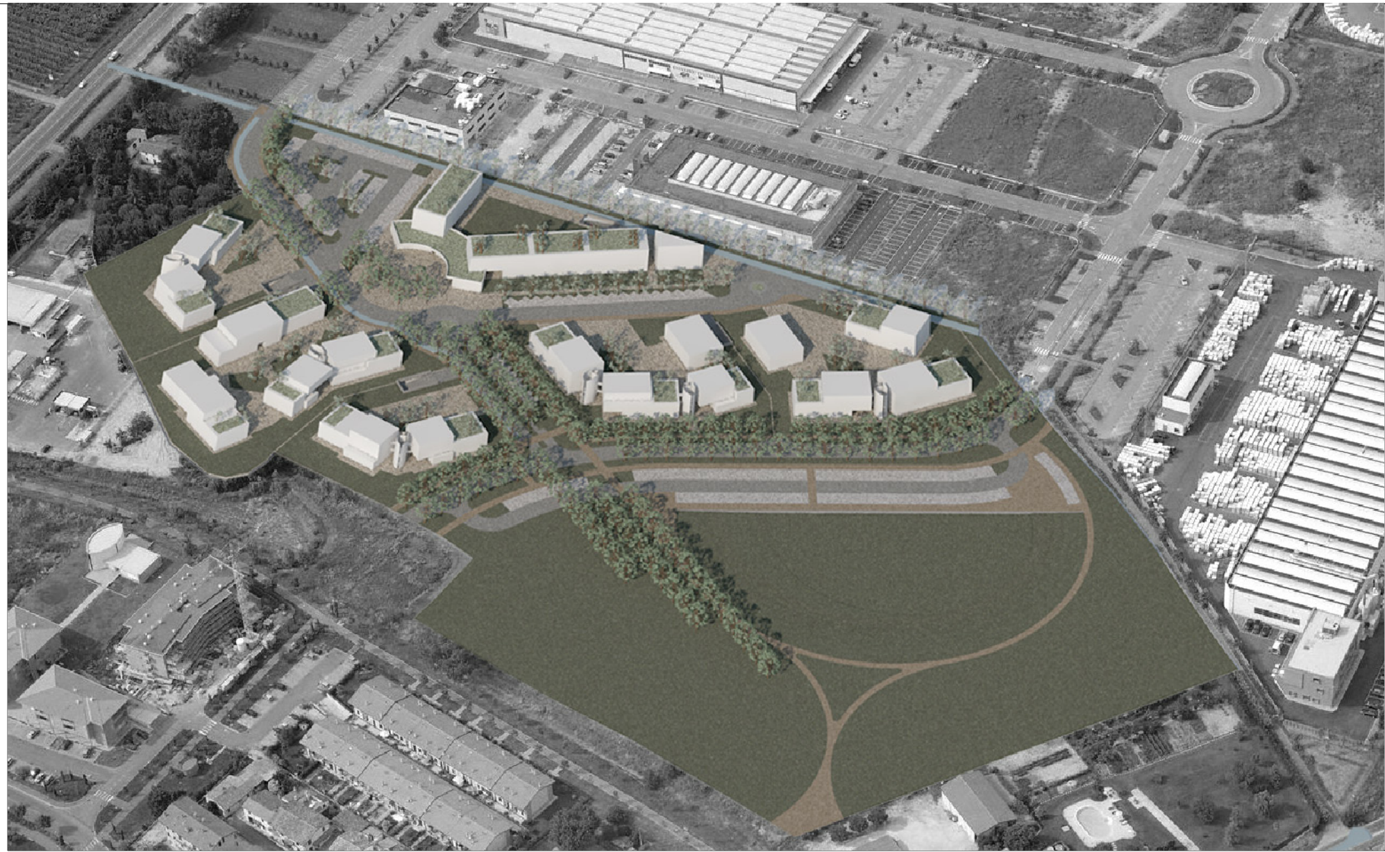
3 - FOTOINSERIMENTO - VISTA AEREA DA SUD OVEST