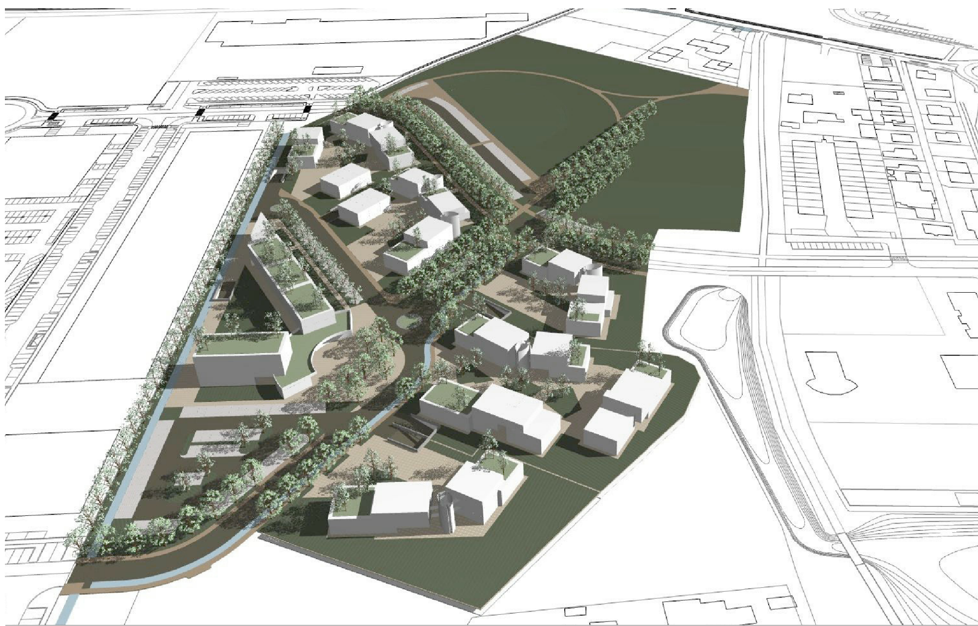
6 - STUDIO VOLUMETRICO - VISTA DA NORD EST