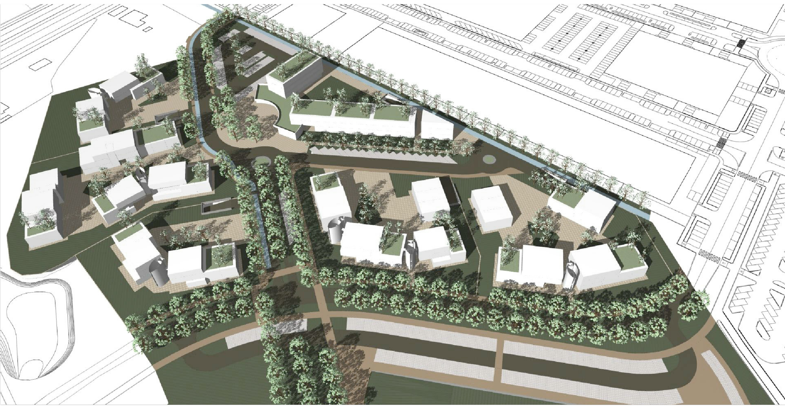
8 - DIAGRAMMA PERCORSI PEDONALI, CICLABILI E CARRABILI NEL COMPARTO URBANIZZATO- VISTA DA SUD